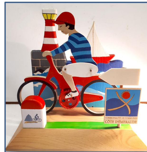
Maquette du Vélo Solaire Mobile de la CCCE confectionné par HELIOBIL

15:45 – 16:00 Remise du trophée à l'école maternelle François Renaud à Saint-Lunaire